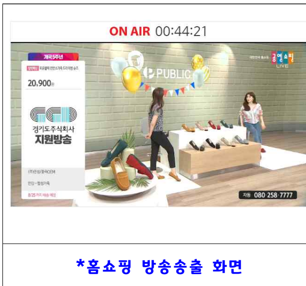
*홈쇼핑 방송송출 화면

※ 지원금 한도 내 방송 횟수 제한은 없으나 상품은 본 사업에서 선정된 제품으로 한정