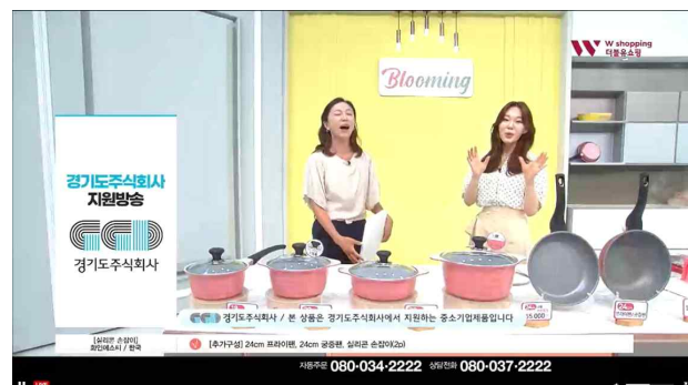
*티커머스 방송송출 화면